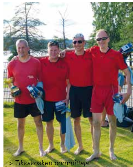
> Tikkakosken pommittajat

Loppuottelussa puolustusvoimien kesto-menestyjä ja kotikentällään pelannut Tikkakosken Pommittajat sai vastaansa poliisijoukkue Nokian hiekkasudet. Loppuottelu oli lopulta Tikkakosken selvää hallintaa ja he voittivat pelin erin 2-0 (21-14, 21-16). Mestaruus oli Tikkakosken Pommittajille jo kuudes. 🌟