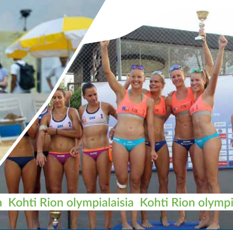
Kohti Rion olympialaisia Kohti Rion olympialaisia Kohti Rion olympialaisia Kohti Rion olympialaisia