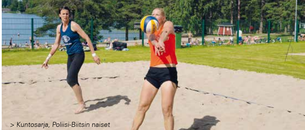
> Kuntosarja, Poliisi-Biitsin naiset