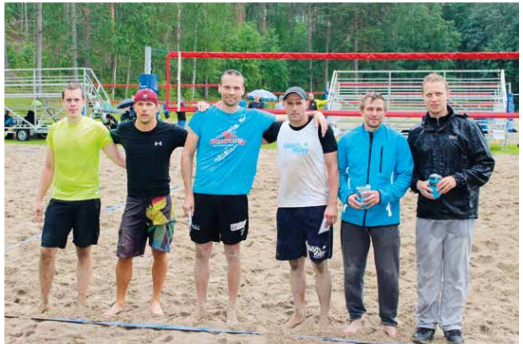
►► Miesten mitalistit

Kiitokset kaikille mukana olleille pelaajille ja toimitsijoille.