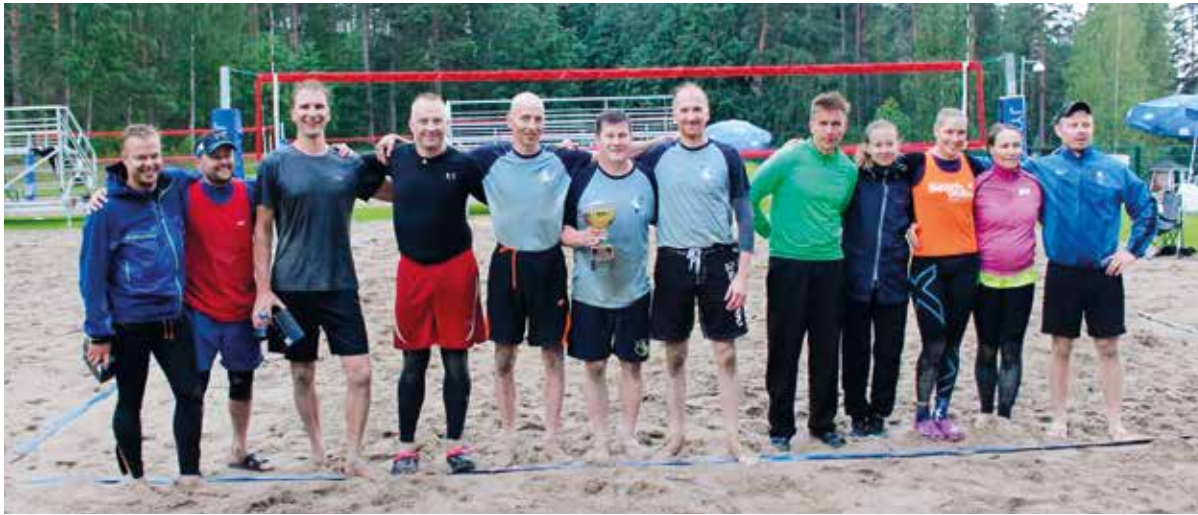
►► Harrastesarjan mitalistit

Toinen välierä oli tiukempi, mutta siinäkin voiton vei Tikkakoksen joukkue, tällä kertaa siis Mannekiinit, joka voitti pelin erin 2-1.